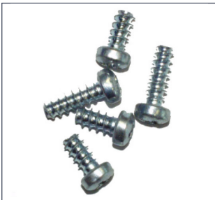
EJOT Delta PT ® Schraube

Achtung: Die Delta PT ® -Schrauben besitzen kein metrisches ISO Regelgewinde nach DIN 13, daher sind sie nur für die Kunststoff-Einlegeile verwendbar.