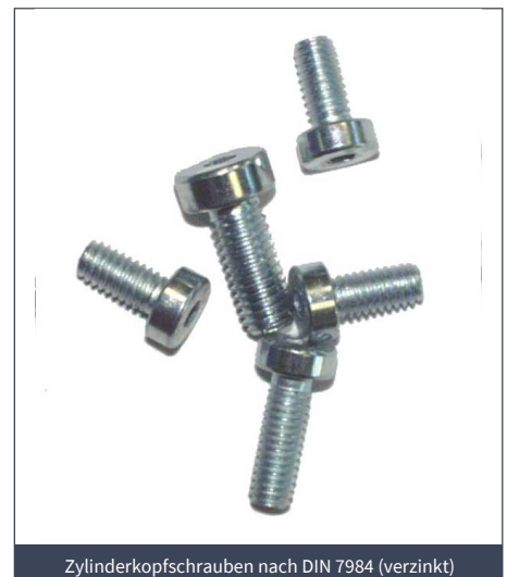
Zylinderskopfschrauben nach DIN 7984 (verzinkt)