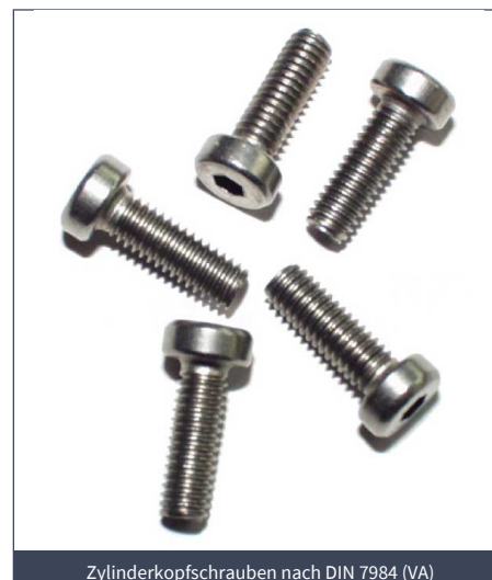
Zylinderkopfschrauben nach DIN 7984 (VA)