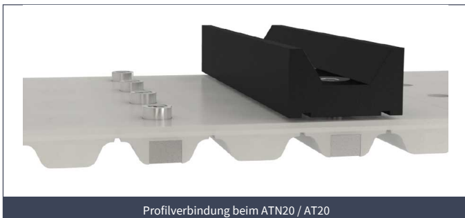
Profilverbindung beim ATN20 / AT20