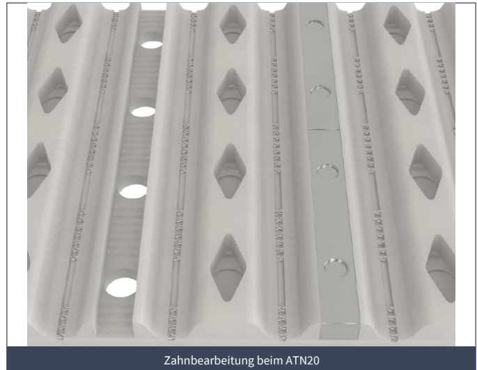
Zahnbearbeitung beim ATN20

Ein weiterer Vorteil dieser Verbindung ist die Möglichkeit, das ATN-Prinzip auch auf andere Zahnriementypen anwenden zu können. So lassen sich BRECOFLEX®- und BRECO®-ZAHNRIEMEN der Typen AT10 und AT20 nach entsprechender Bearbeitung mit aufgeschraubten Profilen bestücken, so dass auch bei diesen „traditionellen“ Transportriemen die Flexibilität des ATN-Systems nahezu erreicht wird.